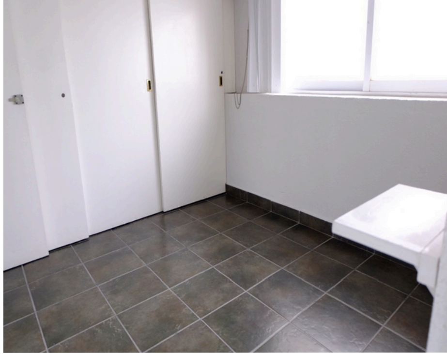
Área lavado y secado