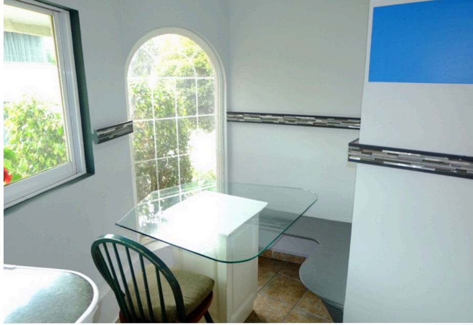
Área de usos múltiples