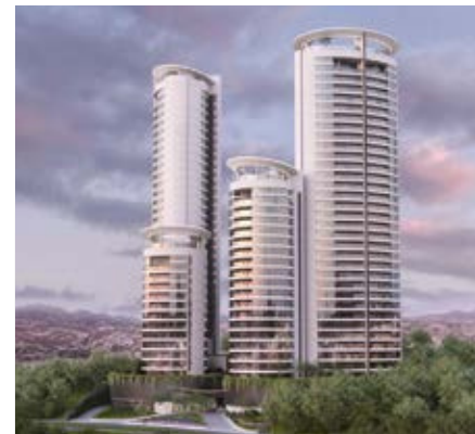
INCANTO RESIDENCIAL BOSQUE REAL