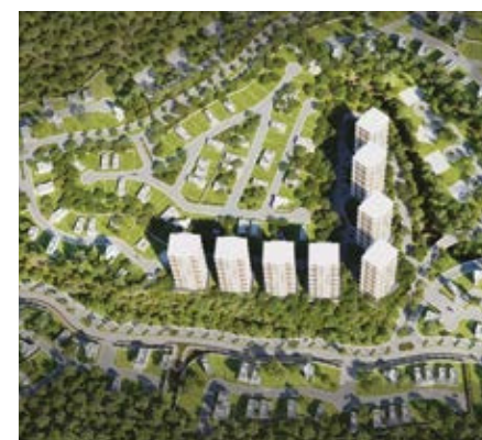
RESERVA LOTES BOSQUE REAL