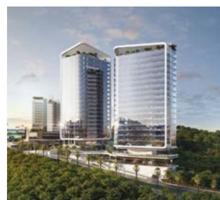
DESIGNO BOSQUE REAL