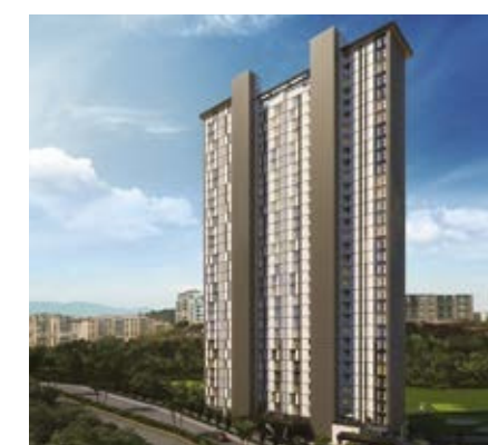
OAKS BOSQUE REAL