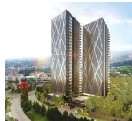
SKY VIEW BOSQUE REAL