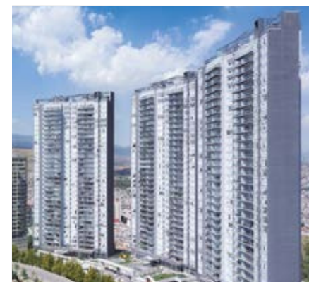
FIVE BOSQUE REAL