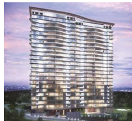
IVY BOSQUE REAL