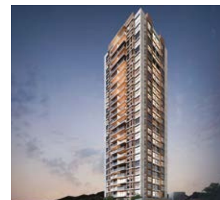
EKATO BOSQUE REAL