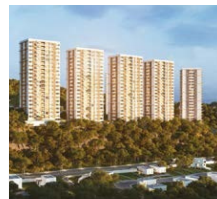
NATIV BOSQUE REAL