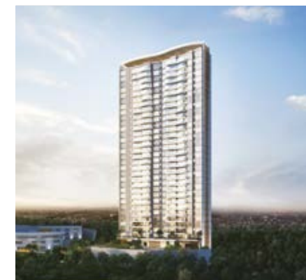
BLUE BOSQUE REAL