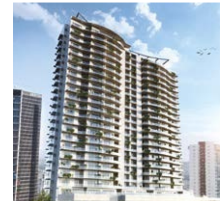
BOEHM BOSQUE REAL