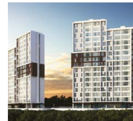
ARGENTA TOWERS BOSQUE REAL