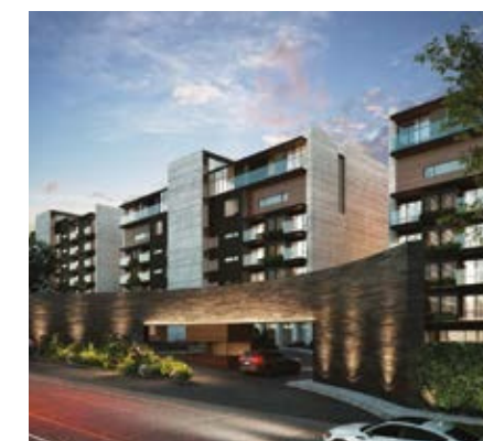
LE BOSQUE REAL