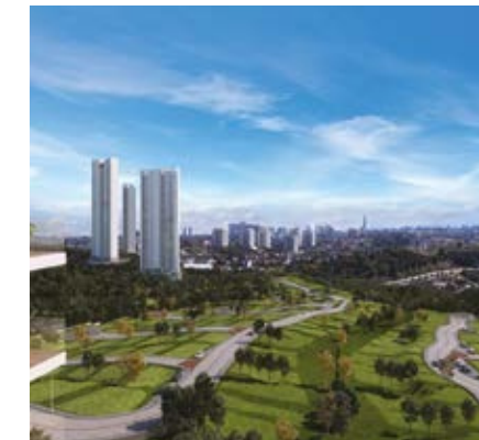
LA VISTA LOTES BOSQUE REAL