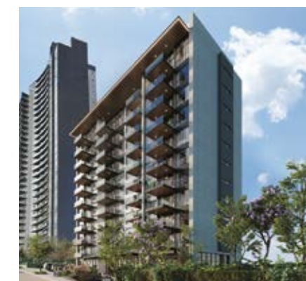
NOX BOSQUE REAL