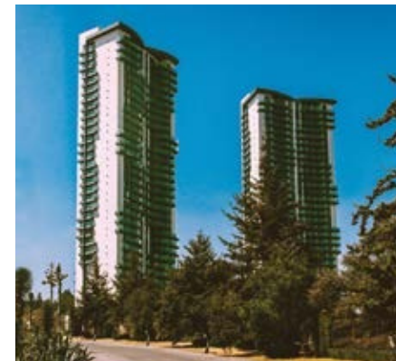
RESIDENCE BOSQUE REAL