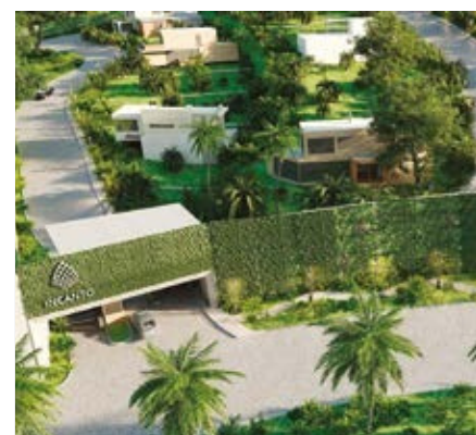
INCANTO LOTES BOSQUE REAL