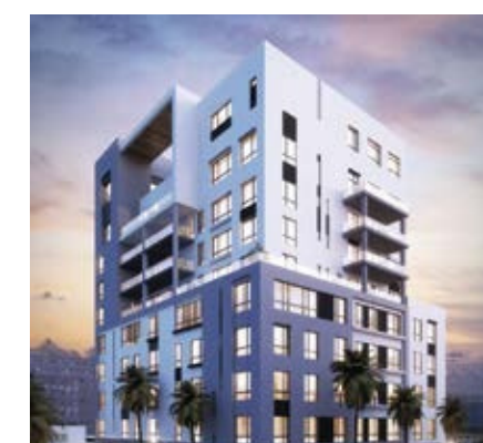
SKY VIEW FLORIDA