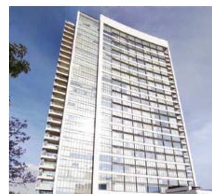
LA VISTA TOWERS PUEBLA