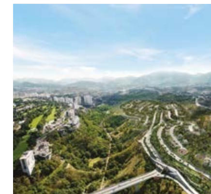
LIFE BOSQUE REAL