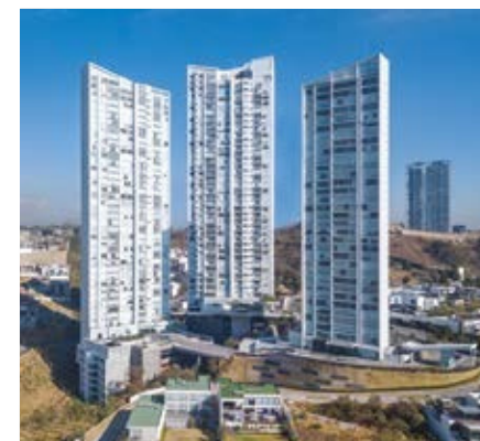
BOSQUEREAL TOWERS BOSQUE REAL