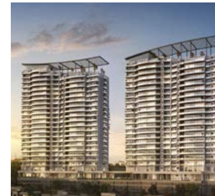
LA VISTA BOSQUE REAL